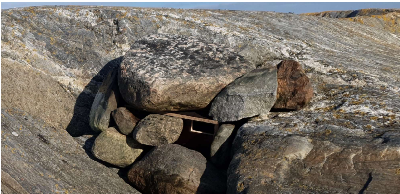
Kuva 1. Vesivanerista tehdyt pesimälaatikot piilotetaan osittain kivikoihin. Laatikon koko on noin 10 x 10 x 20 cm.

Tutkimuksen puitteissa rengastetaan kaikkia lintulajeja, mutta toiminta keskittyy saariston tyyppilajeihin eli sorsa-, kahlaaja-, lokki-, ruokki- ja tiettyihin varpuslintuihin. Emopyyntiä katiskalla tai iskuloukulla tehdään valikoidusti, erityisesti kahlaajien, lorkkilintujen ja luotokirvisen osalta. Luotokirvisen osalta käytetään tavanomaisen rengastuksen lisäksi myös lukurengastusta sekä viedään saarille ja luodoille yksittäisiä huomaamattomia pesimäpönttöjä (kuva 1).