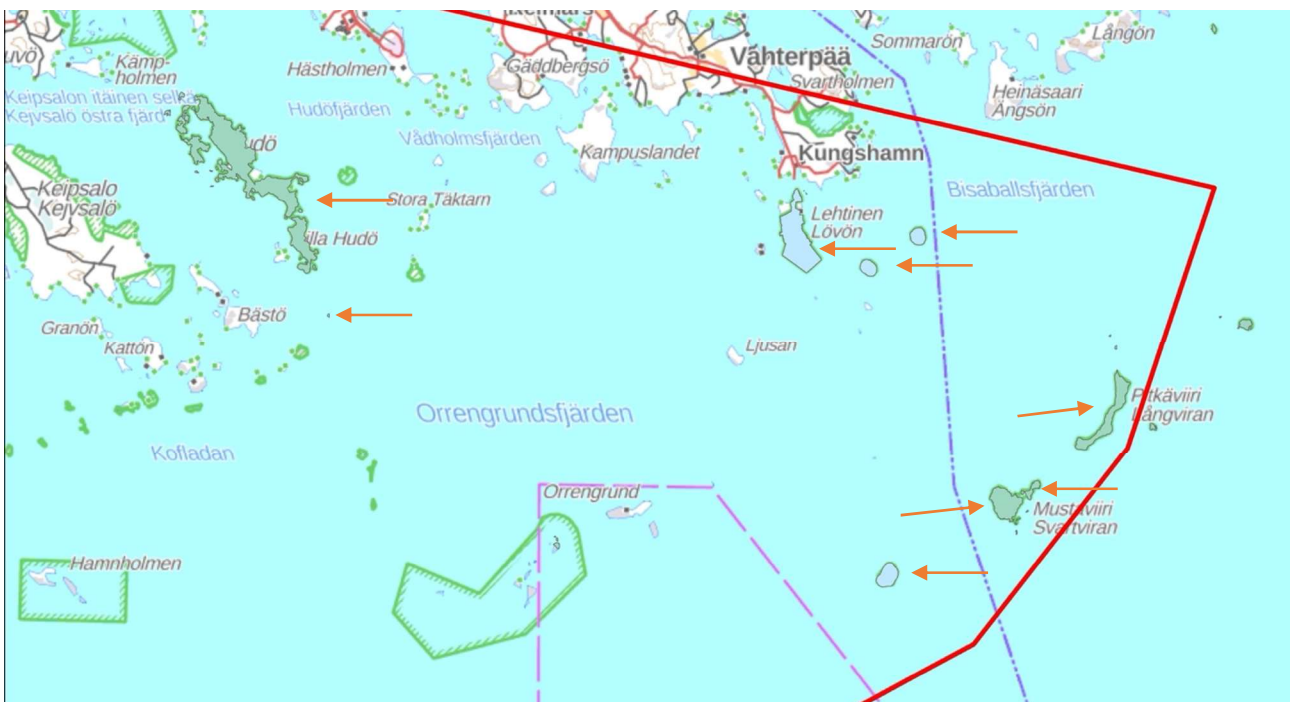
Kuva 3. Tarkempi kuva lupahakemuksen kohteena olevista saarista ja saariryhmistä (valtion suojelualueet ja Itäisen Suomenlahden kansallispuistoon kuuluvat saaret).