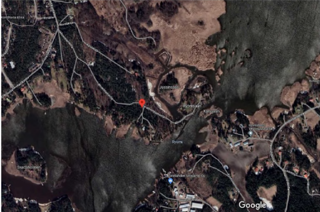
Kuva 1. Sateliittikuva tontista nykytilassaan.

Asemakaavamuutos alue sijaitsee Ahvenniementien varrella, osoitteessa Ahvenniementie 62c. Muutosalue on noin 3 500 m 2 .