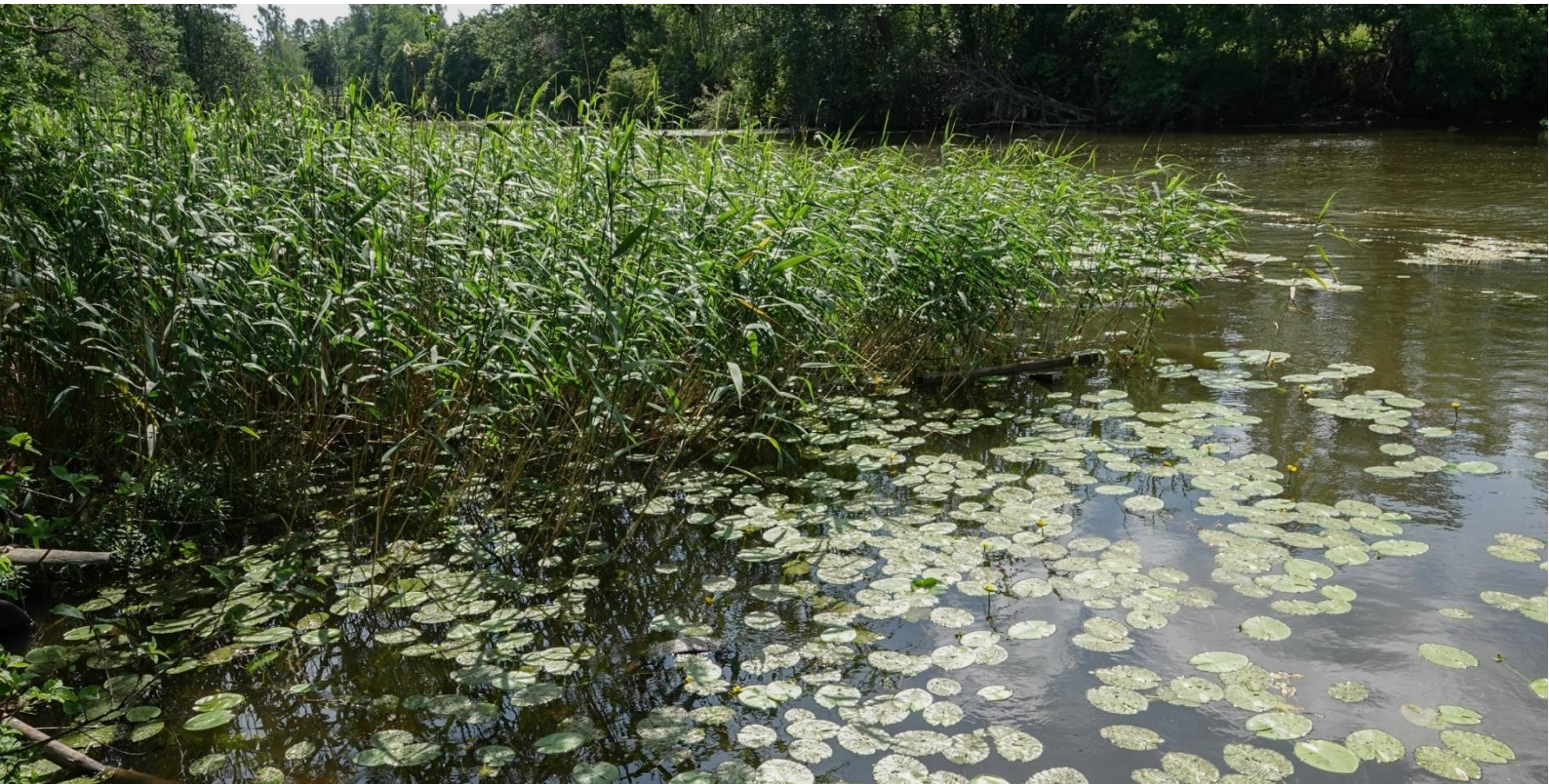
Kuva 5. Kymijoen vesikasvillisuutta Pyhtää k:n suunnittelualueella. Pyhtää 17.7.2023