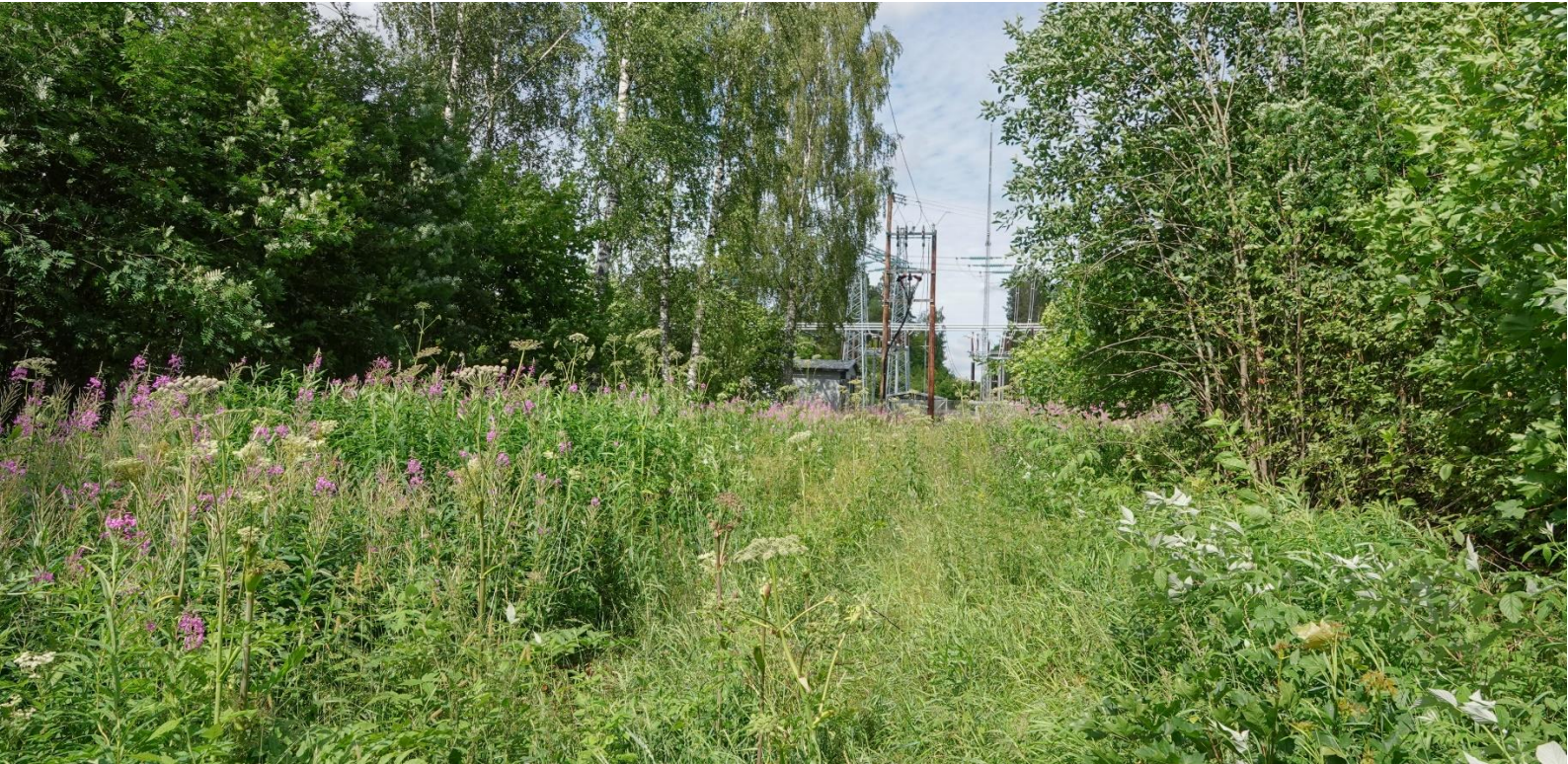
Kuva 4. Suunnittelualan eteläosan sähkölinjalla kasvaa maitohorsmaa ja putkia. Pyhtää 17.7.2023