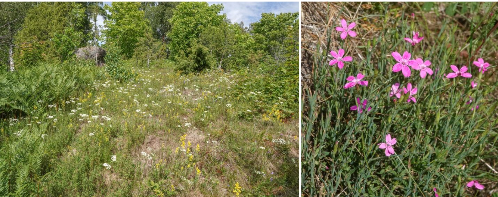
Kuva 6 (vas.). Harvinaista karua pienruohoketoa CR Pyhtää kk suunnittelualueella. Kuva 7 (oik.). Ketoneilikkasvusto Pyhtää kk karulla pienruohokedolla CR. Pyhtää 17.7.2023

Joenrannan kasvillisuus on hyvin rehevää: metsävaahteraa, koivua, lehtotuomea, tervaleppää ja terttuseljaa, sekä kenttäkerroksessa runsaasti vuohenputkea. Rantapuustona kasvaa tervaleppää, ja rantavedessä kaapeana ilmaversoisvyöhykkeenä järviruokoa ( Phragmites australis ). Rannassa on huonokuntoisia laiturirakennelmia, joiden ympärillä esiintyy paljon isoulpukkaa ( Nuphar lutea ) (kuva 5) ja uistinvitaa ( Potamogeton natans ) sekä uposkasvina ruskoärviää ( Myriophyllum alterniflorum ).