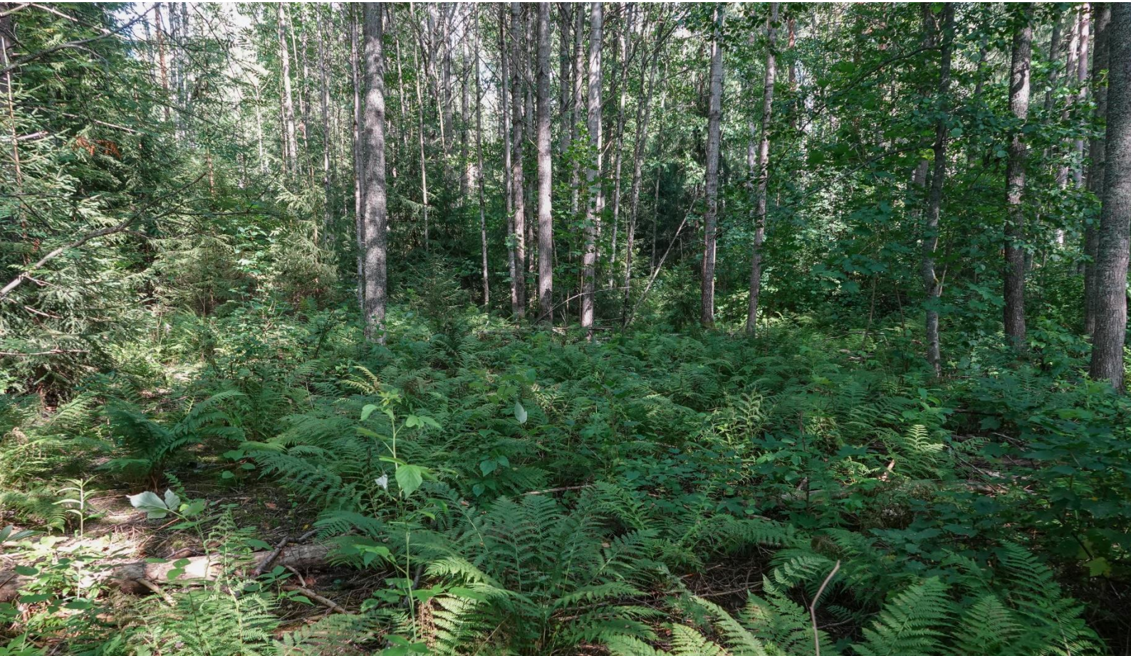
Kuva 3. Huutjärven suunnittelun alueen kulttuurivaikutteista lehtoa ja liito-oravalle sopivaa metsää. Pyhtää 17.7.2023

Ojan läheisyydessä kasvaa metsähaapoja sekä tervaleppiä, joista yksi on huomattavan suuri ja kolmihaarainen. Alueella on riittävästi metsäkuusta liito-oravan tarvitsemaksi suojapuustoksi.