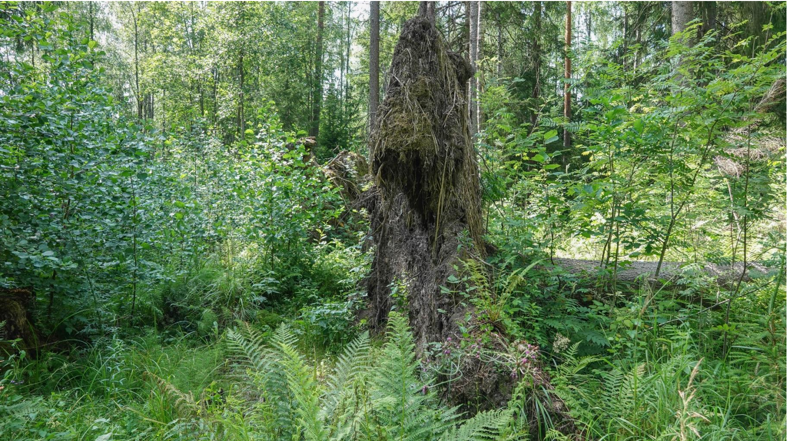
Kuva 2. Suunnittelualueen Huutjärvi S kosteapohjaista eteläosaa. Pyhtää 17.7.2023

Suunnittelualueen läntisessä osassa on runsaasti metsähaapaa kasvavaa ja liito-oravalle Dir IV, VU sopivaa kulttuurivaikutteista lehtoa. Aivan suunnittelualueen lounaiskulmassa, ojan varressa, on pienialainen kuvio varttunutta metsäkuusivaltaista mustikkatyypin kangasta.