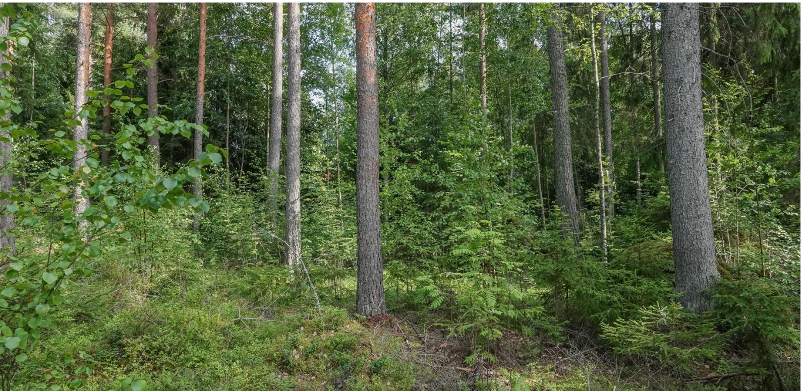
Kuva 1. Huutjärven suunnittelualueen pohjoisosan mustikkatyypin kangasta. Pyhtää 17.7.2023

Suurelta osin metsäpeitteinen suunnittelualue sijaitsee Huutjärventien eteläpuolella, Hirventien ja Karhuntien välissä. Karhuntien varsi on kokonaan rakennettua, ja lisäksi alueen pohjoisosassa on yksi omakotitalotontti. Alueen pohjoisosa on varttunutta ja harvennettua metsäkuusivaltaista mustikkatyypin kangasta (kuva 1), jonka sekapuustona kasvaa vanhoja metsämäntyjä ja rauduskoivuja ( Betula pendula ). Pensaskerroksessa esiintyy paljon pihlajan ( Sorbus aucuparia ) taimia. Metsissä esiintyy niukasti lahoppua. Marjova mustikka ( Vaccinium myrtillus ) on kenttäkerroksen valtalaji, mutta alueella kasvaa myös mm. kangasmaitikkaa ( Melampyrum pratense ).