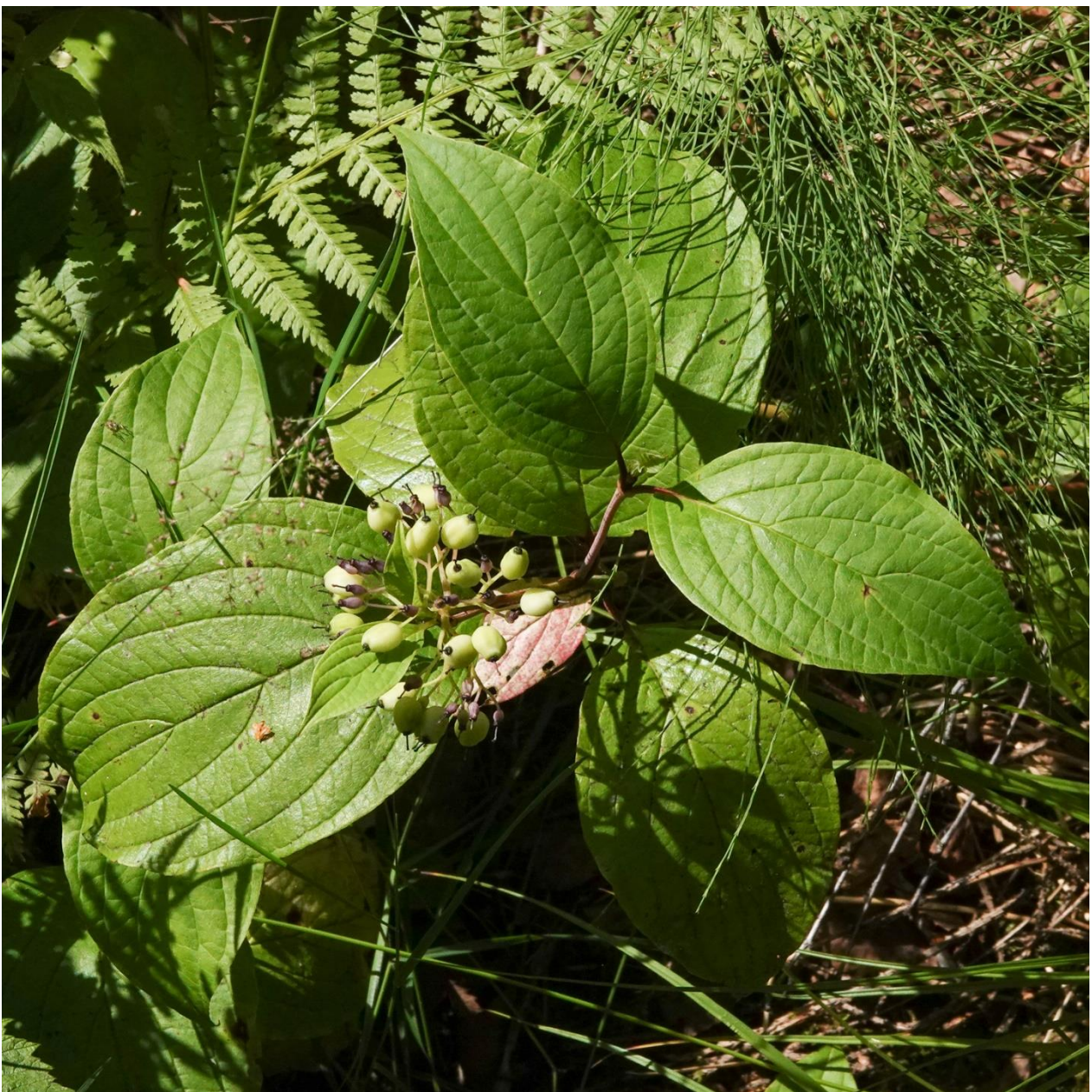
Kuva 8. Pensaskanukka Huutjärvi S suunnittelualueella. Pyhtää 17.7.2023

Huutjärvi S suunnittelualueen pohjoispäässä, harvennetun metsän pienessä aukossa, kasvaa noin aarin laajuinen kasvusto kirjoverkkoperhosen ( Euphydryas maturna ) Dir IV toukkien tärkeintä ravintokasvia kangasmaitikkaa ( Melampyrum pratense ). Lajin lisääntyminen alueella ei ole kovin todennäköistä, mutta ennen mahdollista alueelle rakentamista on syytä tarkistaa perhosen esiintymistilanne. Se voidaan tehdä aikuishavainnointina kesäkuussa tai toukkaseittiselvityksenä elo–syyskuun vaihteessa.