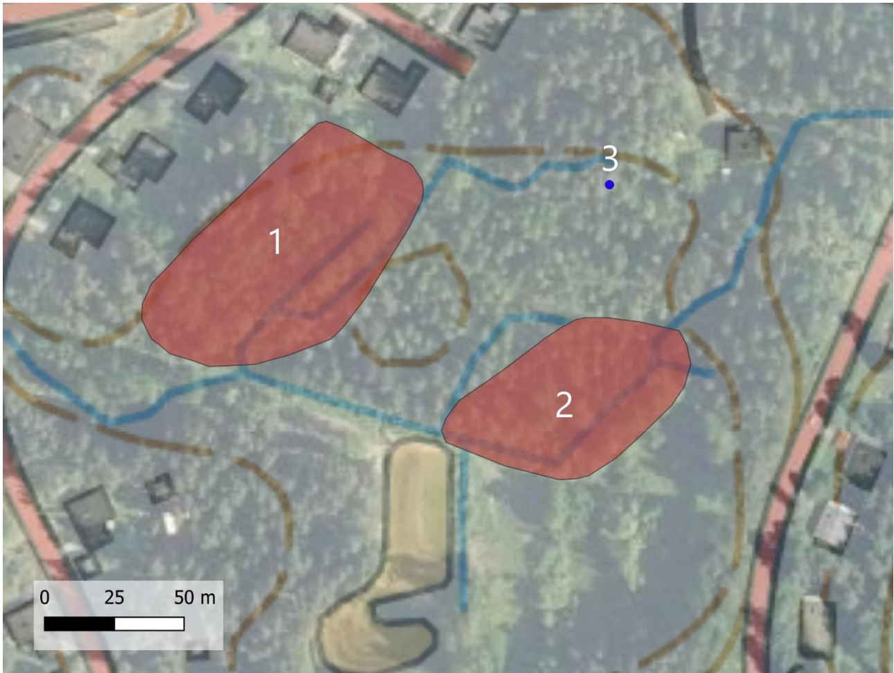
Kartta 3. Huutjärvi S suunnittelualan luontokohteita: liito-oravalle sopivat metsät 1 ja 2 sekä haitallisen vieraslajin esiintymä 3.

mutta versot eivät olleet erityisen punaisia. Kyseessä on joka tapauksessa alkuperäislajistoa syrjäyttävä laajoja kasvustoja muodostava kasvi, joka tulisi hävittää.