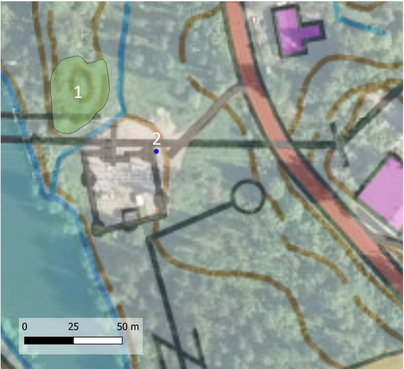
Kartta 4. Pyhtää kk suunnittelualueen luontokohteita: arvokas elinympäristö 1 ja haitallisen vieraslajin esiintymä 2.

pienruohokedot CR kuvausta. Pensaskerroksessa kasvaa katajaa ( Juniperus communis ). Keltamatarata ( Galium verum ) VU on kuviolla runsas, ja monin paikoin esiintyy ketoneilikkakasvustoja ( Dianthus deltoides ) NT. Myös ahomatarata ( Galium boreale ), ahopukinjuuri ( Pimpinella saxifraga ), kissankello ( Campanula rotundifolia ) ja huopavoikeltano ( Pilosella officinarum ) kasvavat runsaina. Myös hopeahanhikki ( Potentilla argentea ) kuuluu kedon lajistoon. Sananjalkaa ( Pteridium aquilinum ) ja kieloa ( Convallaria majalis ) muodostavat kasvustoja kedon reunoilla. Mataroilta haavittiin heinäkuun 2023 maastokäynnillä Suomessa hyvin paikoittaisena esiintyvää pikiludetta ( Legnotus picipes ).