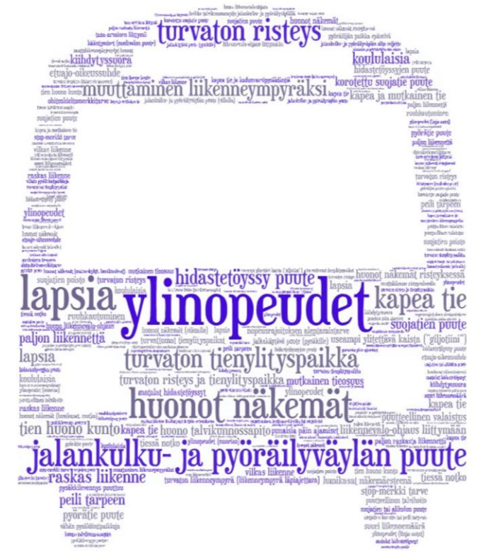
Asukaskyselyn sanapilvi (koko seudun vastaukset)